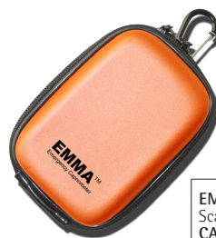
EMMA Custodia Scatola da 10 CAT.NO. 100680