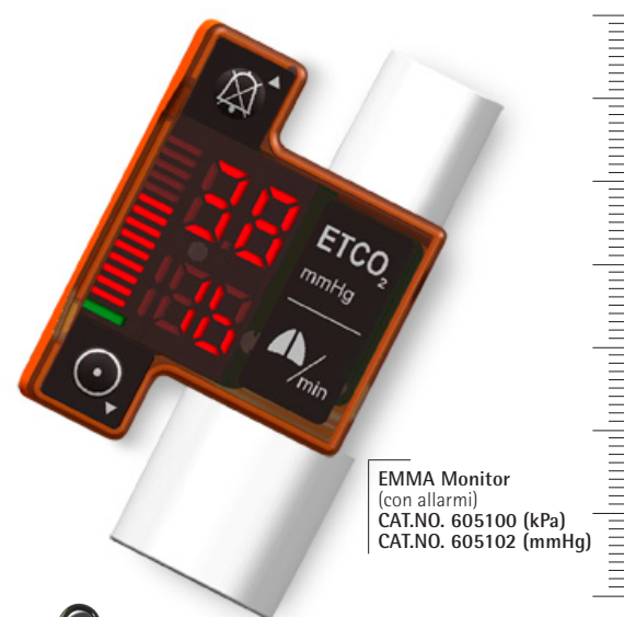
EMMA Monitor (con allarmi) CAT.NO. 605100 (kPa) CAT.NO. 605102 (mmHg)