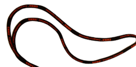
EMMA Tracolla Sacchetto di 10 CAT.NO. 100684